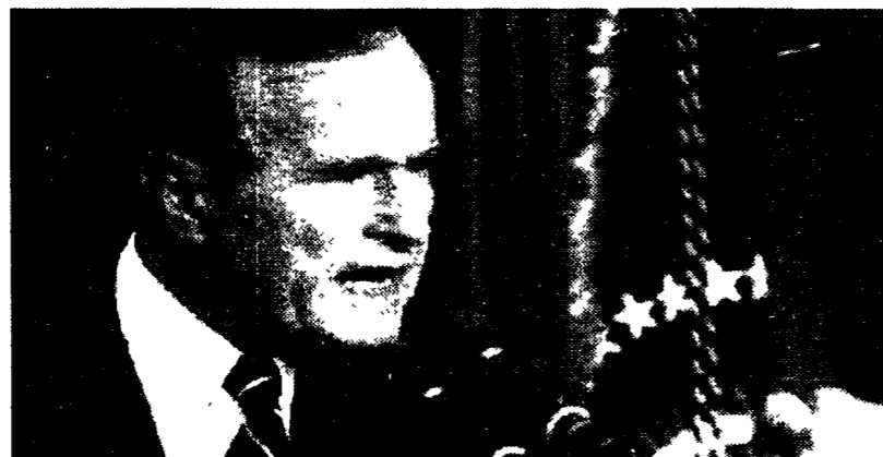
Il presidente degli Stati Uniti George Bush