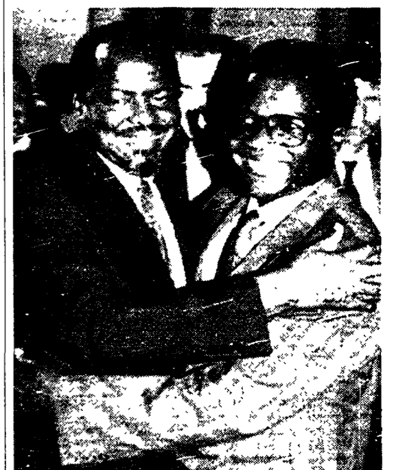
Joaquin Chissano, presidente del Mozambico e Afonso Dhlakama, leader della Renamo, si abbracciano dopo aver firmato il «cessate il fuoco»

■ ROMA Il presidente mozambicano Joaquin Chissano ed il leader della Renamo Afonso Dhlakama hanno firmato ieri a Villa Madama una dichiarazione congiunta in cui si impegnano a concludere entro il primo ottobre il negoziato in corso da due anni a Roma per porre fine alla guerra civile nella ex colonia portoghese.