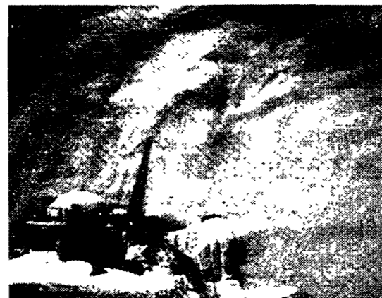
L'astronauta Franco Malerba nell'interno dell'Atlantis. A sinistra un trione, che ha colpito le coste della Cina, fotografato dallo shuttle

ferto la vicenda del satellite col filo. Sono amico dei cani, ma non ho mai sofferto per i guinzagli tanto come questa volta». Ma, ecco, Malerba che non sta nella pelle: «E come se ci fosse scoppiato un pneumatico, ma la macchina ha funzionato bene, il satellite ha funzionato, si è dimostrato stabile. È stato un risultato positivo, quello del satellite al guinzaglio è un concetto valido».