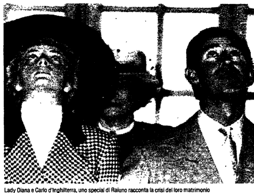
Lady Diana e Carlo d'Inghilterra, uno special di Raiuno racconta la crisi del loro matrimonio