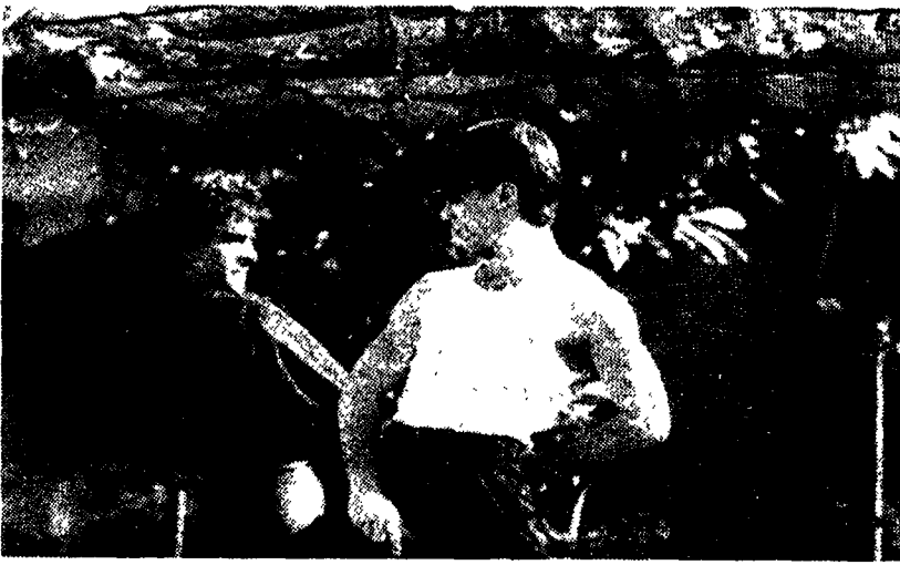
Una scena del film australiano «Strictly Ballroom»

Mentre la giuria presieduta da Guglielmo Biraghi sta dando gli ultimi ritocchi al verdetto (il più accreditato è ancora il tedesco Kinderspiele ma sono cresciute le azioni dell'hongkonghese Qiyue), il quarantacinquesimo festival di Locarno, il primo pilotato da Marco Müller, si avvia a chiudere i battenti. Molta gente nelle sale e in Piazza Grande, qualche malumore sulla scelta dei film in concorso.