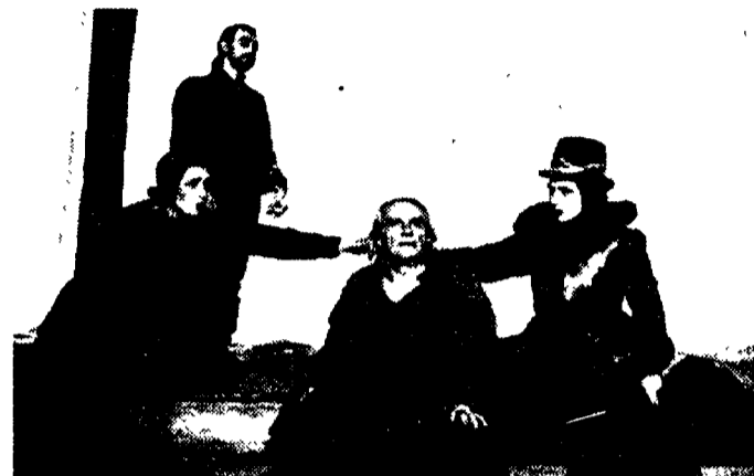
Due immagini di Giorgio Albertazzi, protagonista di «O Lear, Lear, Lear» che ha debuttato a Taormina