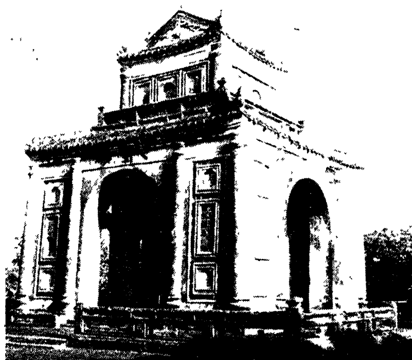
Huê. La tomba di re Tu Duc

A Sud di questo scoppietante agglomerato urbano, si allarga il ventaglio del Delta del Mekong, imprigionato in un reticolo di canali di drenaggio ed irrigazione. È percorso da file di sampan, carichi di gambie e polli, di maiali, e di bambini. Il naufrago del 1500 si stupiva estasiato alla vista delle coste del Champa, a nord di Saigon, e dei boschi balsamici, talmente profumati che il fiume che li attraversa se ne impregna, porta il nome di «Fiume dei profumi». L'essenza che se ne ricava è il prezioso Junshur. Basterebbe spingersi di poco, nelle ombre dei boschi, per scoprire una grande varietà di orchidee aeree, sospese ai rami, gialle e lilla. Il regno dei Champa, pirati dell'XI secolo, ha cessato di esistere da tempo. Ma a Nha Trang i loro discendenti continuano ad aggirarsi intorno ai templi abbandonati che si ergono sulle alture. Piccoli e scuri si abbarbicano, come le piante di capren, attorno al loro unico «Tempio Vivente», il Po Nagar