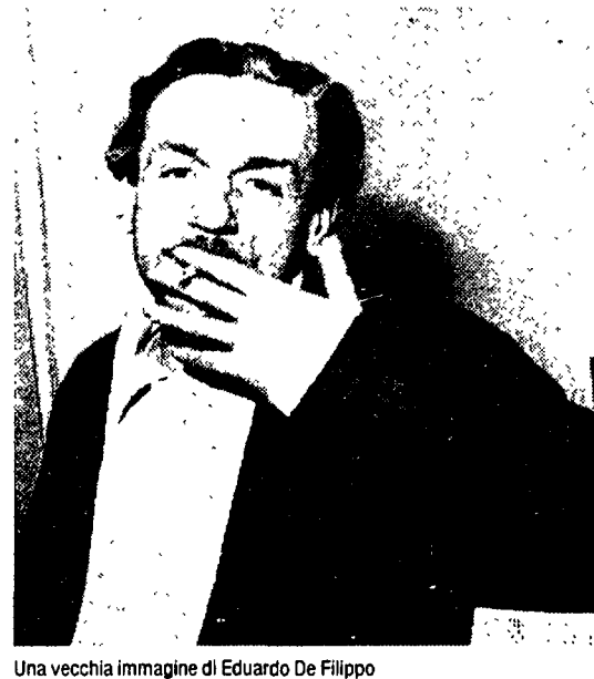
Una vecchia immagine di Eduardo De Filippo

La commedia di stasera fa parte del ciclo «Napoli racconta...», sezione di «Palcoscenico» dedicata alla messa in onda di opere della cultura e della tradizione partenopea, che si è inaugurata il 17 agosto scorso, con O tuono e marzo di Vincenzo Scarpetta, regista e interprete lo stesso Eduardo, nel ruolo marcatamente mac-