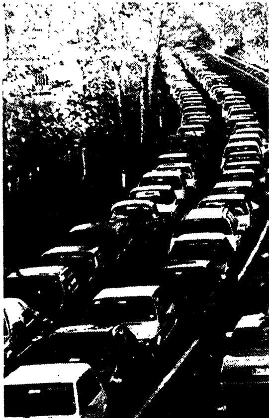
Uno squarcio della città «chiusa per ferie» durante lo scorso mese di agosto

Bilancio del centralino Emergenza estate allestito dal Comune 1500 chiamate in 10 giorni