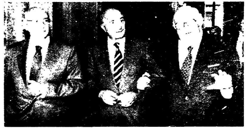
Il presidente della commissione bicamerale De Mita con i presidenti della Camera, Napolitano e del Senato, Spadolini