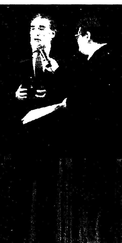
Vittorio Gassman e, a destra, Gino Paoli

L'idea di una grande manifestazione «gioiosa» nella tormentata Palermo era venuta già all'indomani di quella imponente del 27 giugno, quando decine di migliaia di persone sfilarono meste per le strade della città. E allora che ai responsabili del sindacato, che avevano chiamato i lavoratori a scendere in piazza contro la mafia, venne l'idea di trovare un linguaggio comune con i giovani dei quartieri disperati, per aiutarli a praticare una cultura diversa da quella della mafia. Quella della musica, per cominciare. Palermo poteva «dimostrare» la sua coscienza antimafia senza dolore, con un concerto, uno spettacolo, che diventasse un «evento».