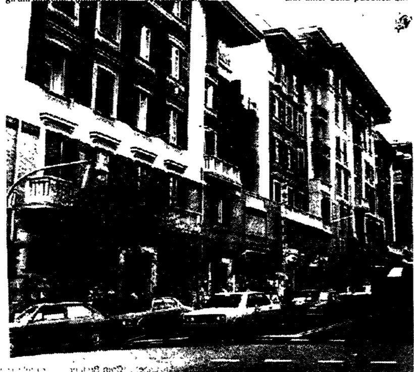
Appartamenti in una via di Roma

L'asse di questa delega è il trasferimento alle Regioni della riscossione dei contributi sanitari con contestuale taglio del fondo sanitario nazionale. Le stesse Regioni, se vorranno assicurare l'assistenza, dovranno aumentare i contributi del dieci per cento. La sanità pubblica garantirà la medicina di base (in pratica l'ospedale) aprendo le porte agli operatori privati. I contenuti della legge stanno già suscitando reazioni negative fra i medici; gli assistenti e gli aiuti ospedalieri minacciano uno sciopero se il governo non li convocherà per ascoltare le loro ragioni.