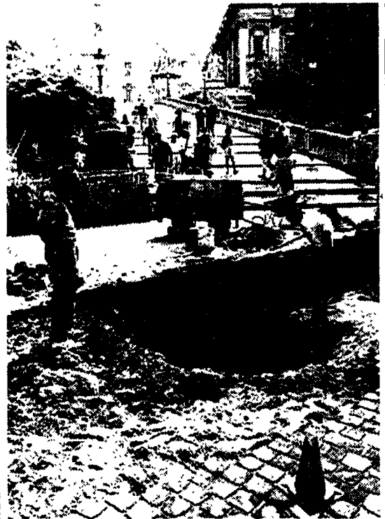
Lavori in corso sotto la scalinata all'Ara Coeli. Un buco enorme proprio davanti alla scalinata monumentale dell'Ara Coeli.

Arrestati un boss del narcotraffico e quattro corrieri dalla Guardia di Finanza, che ha anche sequestrato 12 chili di cocaina, 3 chili di eroina, 130 milioni e cinque macchine di grossa cilindrata.