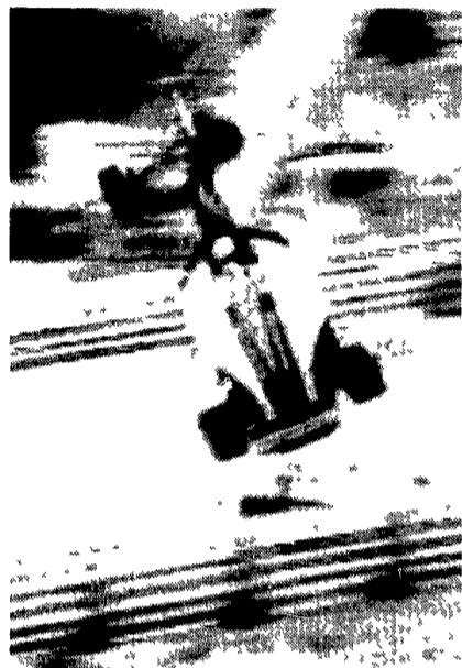
La vettura di Riccardo Patrese vola in aria dopo aver toccato le ruote della macchina di Gerhard Berger. Un incidente terribile da cui il pilota italiano si è miracolosamente salvato

Non è morto Riccardo Patrese sulla pista dell'Estoril come per un attimo anche lui deve aver pensato mentre la sua vettura dopo aver urtato le ruote della monoposto di Gerhard Berger volteggiava per l'aria giocattolo in balia dei capricci del vento. Non è morto il formidabile dei vivi da vivo scivolato alla morte. Ha preso ad invecchiare contro il pilota responsabile del suo pauroso volo. Contro l'austriaco Gerhard Berger lacerato di asfissio «riminiale» d'olite.