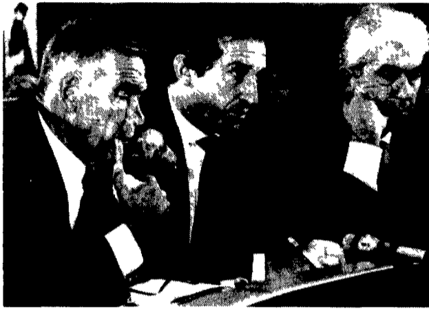
I segretari confederali Cgil Cisl Uil Trentin: D'Antoni e Larizza a lato il leader della minoranza Cgil Bertinotti