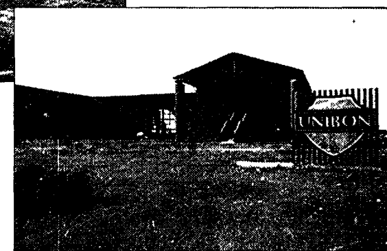
SEDE DIREZIONALE UNIBON Modena