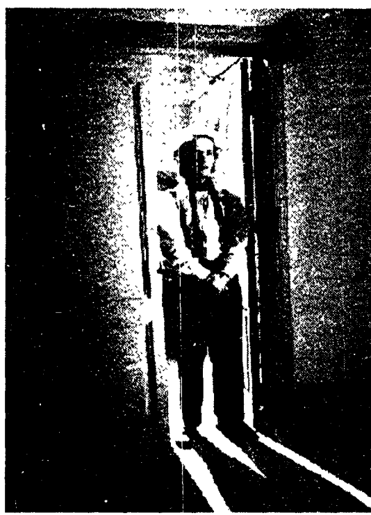
«La voce della luna» in onda stasera su Raiuno alle 20.40