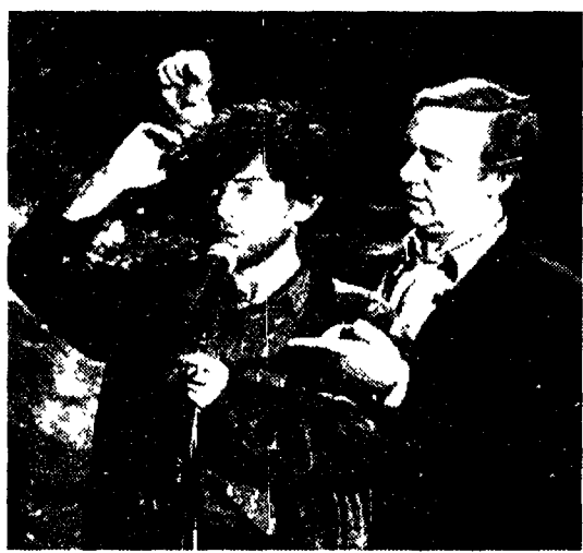
Paolo Rossi e Cochi Ponzoni in «Su la testa»