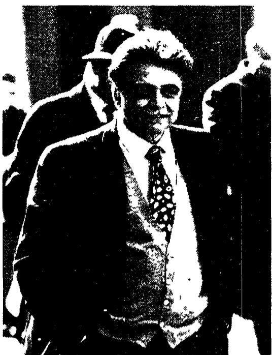
Il segretario del Pds Achille Occhetto