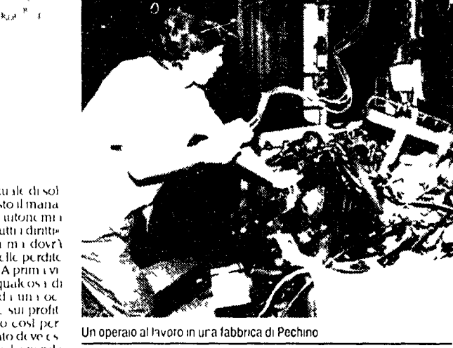
Un operaio al lavoro in una fabbrica di Pechino