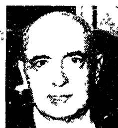
Napolitano d'accordo con Scalfaro sulla Lega

«Credo che il presidente della Repubblica abbia fatto un concilio» principi di carattere generale... (text continues)