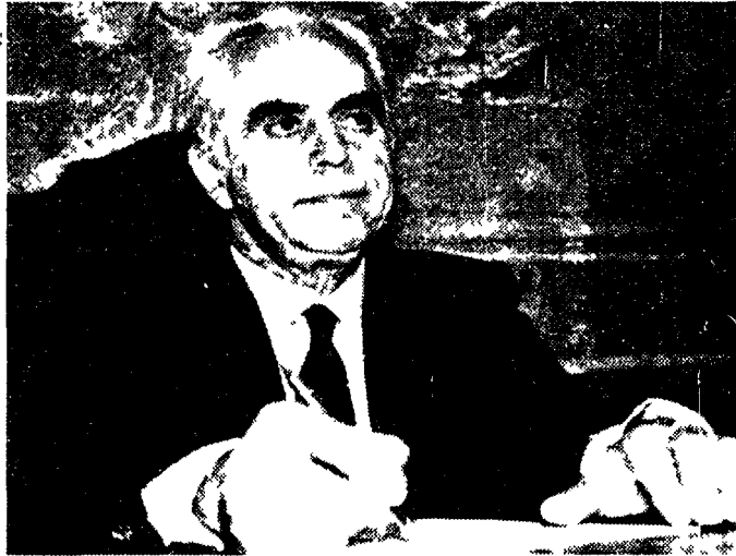
Pietro Scoppola, esponente del movimento dei Popolari

no l'intenzione di distruggere i partiti? No l'unitarietà del referendum... (text continues)