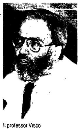
Il professor Visco

I sieropositivi non possono sposarsi, né avere rapporti sessuali. Lo sostiene un docente di teologia morale sulla rivista di bioetica pubblicata dall'università Cattolica.