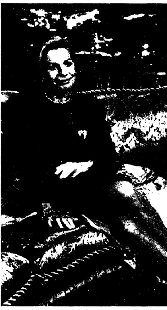
Catherine Spaak conduce la quarta edizione di «Harem»

Tutto il contrario della tv spazzatura. Da sabato 24 ottobre ritorna per la quarta volta «Harem, il talk-show al femminile condotto «sottovoce» da Catherine Spaak. Praticamente la stessa formula degli anni scorsi: tre signore a parlare di sentimenti e un uomo misterioso che si rivela alla fine per commentare il tema della puntata. «Ma stavolta ci sarà un contraddittorio tra i due sessi». Su Raitre alle 22.45.