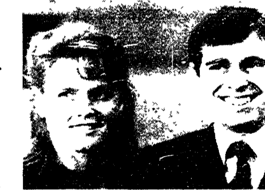
Sarah Ferguson e il principe Andrea