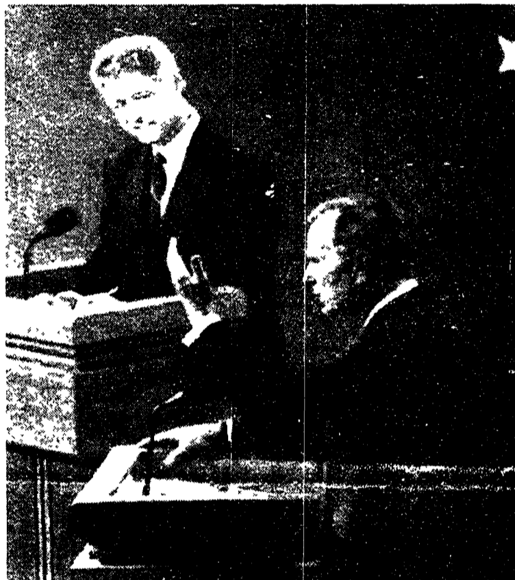
George Bush e Bill Clinton ieri si sono affrontati nell'ultimo dibattito televisivo