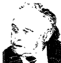
Occhetto incontra Miklos Vasharely