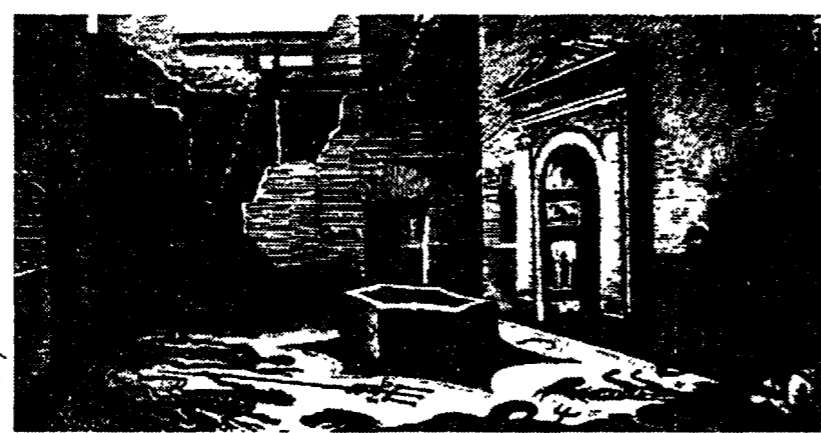
Una vecchia stampa degli antichi quartieri popolari romani

Il pericolo degli incendi nell'antica Roma aveva reso necessario un corpo di vigili del fuoco e caserme attrezzate. Oggi se ne può vedere una superstita, con un centinaio di graffiti che spiegano il tipo di lavoro svolto.