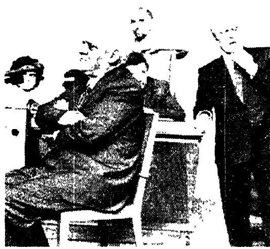
Salvo Lima e Vito Ciancimino durante un processo

Vito Ciancimino ha chiesto, con una lettera, di essere ascoltato dalla commissione Antimafia. L'ex sindaco di Palermo, condannato a 10 anni di carcere per associazione mafiosa, questa volta sembra avere qualcosa di importante da dire: «Il delitto Lima non può essere liquidato con ipotesi semplicistiche sul movente».