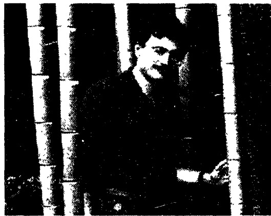
Stefano Ardito, conduttore di «Geo»

co di Roma (fondato nel 1660, trasferito ai piedi del Gianicolo nel 1883), che - ha spiegato Ardito - ospita circa tremila specie di vegetali, migliaia di piante provenienti da ogni parte del mondo, ottime per fornire lo spunto per viaggi anche fantastici intorno alla terra.