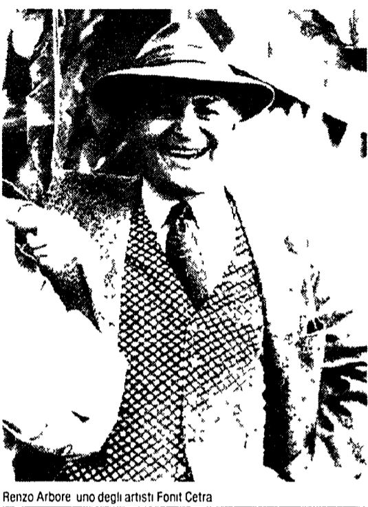
Renzo Arbore, uno degli artisti Fonit Cetra.

I lavoratori della Nuova Fonit Cetra si sono rivolti alla capogruppo la Rai perché sia fatta chiarezza sul rallentamento produttivo e sulla volontà politica volta alla privatizzazione (il 10 per cento e già della Rai) visto che l'azienda è stata e rimane tuttora per eredità un prestigioso marchio italiano che si contrappone alle multinazionali del settore discografico. Sulla natura societaria della Fonit e sul doppio marchio della casa Arzuffo, star della casa Arzuffo, ha fatto una battuta alla presentazione di un suo ultimo disco. «Sono l'unico cantante al mondo ad avere due case discografiche in serie di cui andare orgoglioso», ha ricordato che è quello di Verdi la Fonit che è della Rai.