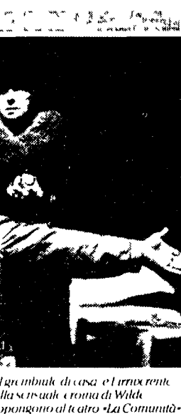
Salomé senza chi me la cavò di un'impresa. L'azione napoletana di Giuseppe G. di un'impresa. La Pappa e Concetta Bara propongono al teatro «La Comunità»

IO SPERIAMO CHE ME LA CAVO Dal best seller di Marco D'Orta (una raccolta di temi dei ragazzi delle scuole elementari di Arza) un film di grande stile e vigore girato sullo sfondo di una Napoli magica e misteriosa e si è meritato il premio speciale della giuria alla Mostra del cinema di Venezia FURIO CAMILLO (Via Camilla 44 Tel. 788771-4826919) Allo 21 Spettacolo di danza Mediascena Europa presenta la compagnia «Danzare la vita» in Canto di sapore salsedina . Coreografie di M. Brega seguitano Path to purity coreografie di M. Piazza. Acqua nel vento coreografia di A. Di Sogno. Materiale e immaginario con D. Damiani GHIONE (Via delle Fornaci 37 Tel. 6372294) Vedi spazio Musica classica IL PUFF (Via G. Zanazzo 4 Tel. 581072/5800989) Martedì alle 22-30 PRIMA ONESTI , mercoledì e venerdì alle 22-30 PRIMA ONESTI , giovedì alle 22-30 PRIMA ONESTI , venerdì alle 22-30 PRIMA ONESTI , sabato alle 22-30 PRIMA ONESTI , domenica alle 22-30 PRIMA ONESTI LA CAMERA ROSSA (Largo Tabac