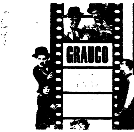
Immagine dalla locandina del «Grauco»