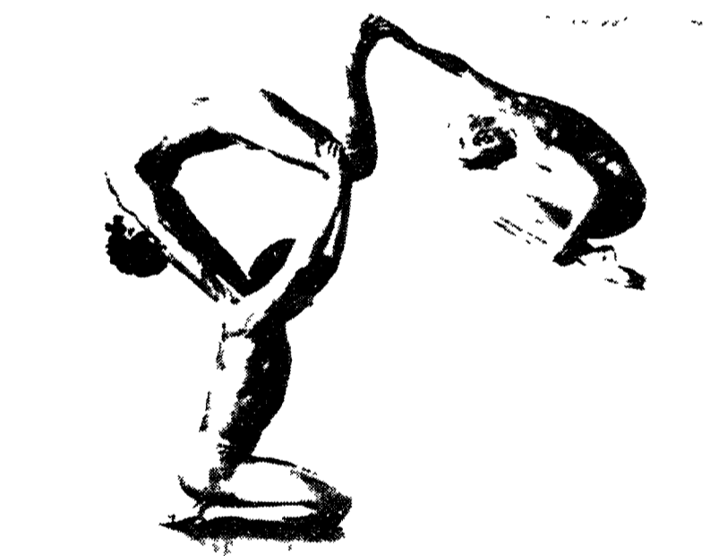
Immagine acrobatica dei «Pilobolus»