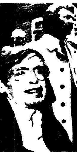
Il astrofisico inglese Stephen Hawking

non fiction (cioè non film, non cartone animato ecc.). Un settore che rappresenta il 15% del mercato e del quale la RCS rappresenta da sola il 12%. Con un ventaglio di offerte anche molto differenziate che vanno dalla Storia dell'arte italiana di Argan alla ricostruzione della inchiesta sulla morte di John Kennedy condotta dal procuratore Garrison alla videointervista di Vittorio Gassman posta a introduzione di un cofanetto di 4 film. Iniziative disparate che sono in qualche modo tenute insieme dall'interesse giornalistico. Quindi dalla volontà di stare dentro il flusso della comunicazione scritta e parlata pur senza fare ricorso al network cioè alla tv, attorno alla quale comunque anche tramite la casa di produzione la Rizzoli sta costruendo una sua non fragile «tela di ragno».