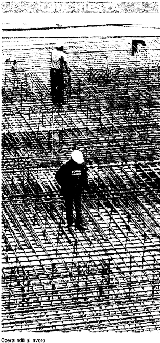
Operai edili al lavoro