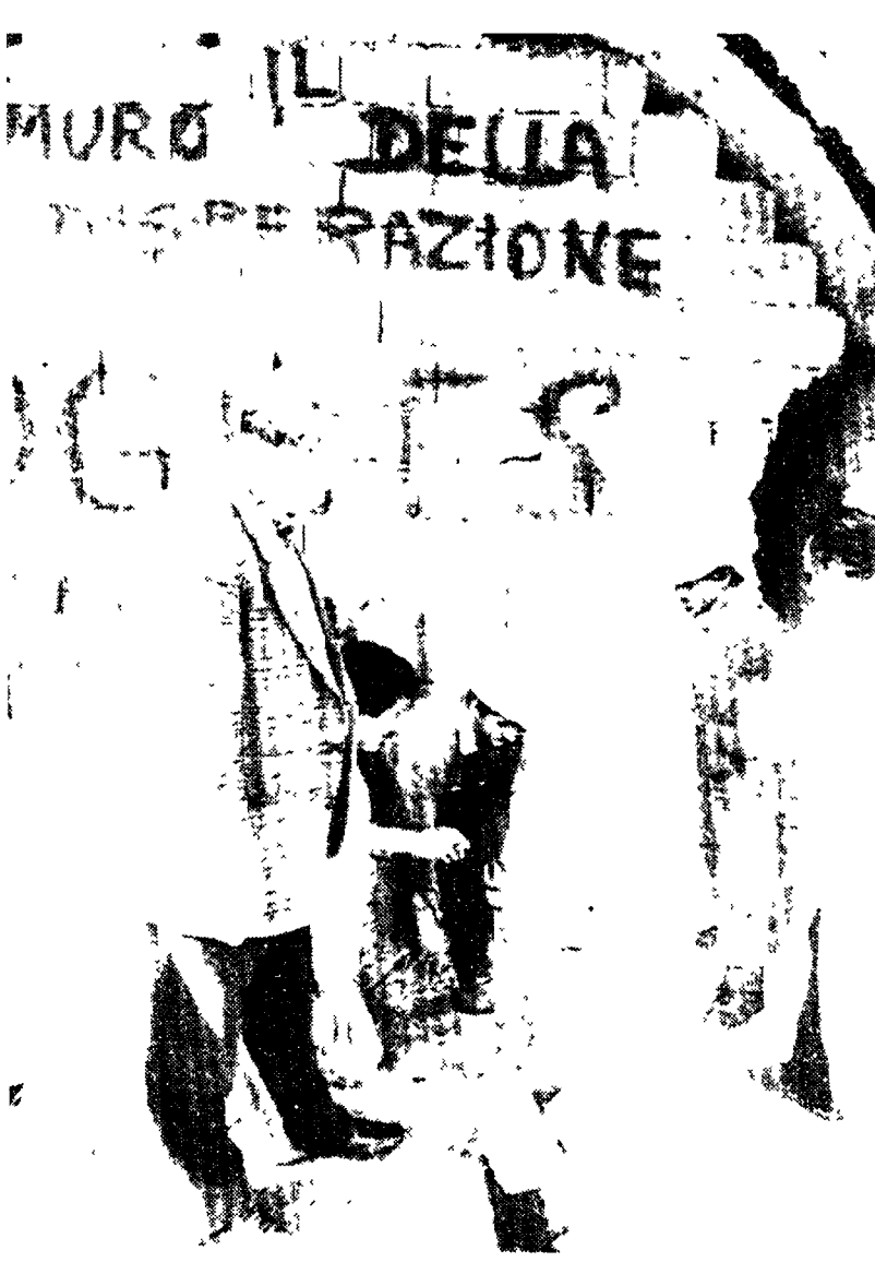
La protesta è finita. Un gruppo di operai di Malvito addetti alla costruzione della diga sull'Esaro esce dal tunnel «della disperazione» nel quale nei giorni scorsi si erano murati vivi