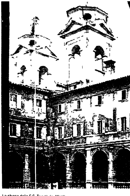
La chiesa della S.S. Trinità dei Monti