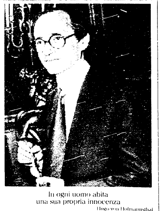
In ogni uomo abita una sua propria innocenza Hugo von Hofmannsthal

domande. Ci si adegua. Ci si abitua a tutto in Tv, persino a Gerry Scotti. Doppieranno Ugo Intini con la voce di Ferruccio Amendola, quella di De Niro. Dirà sempre fregnacce, ma almeno non con quei toni da violino suonato con la raspa. Per il ministro Rosa Russo Iervolino, che parla come un brutto lo stesso strangolando, interverrà la mitica Tina Lattanzi, voce della Garbo. E così via. Anche per le mani si potrà fare qualcosa? Certo quello sarà un lavoro delicato: c'è da sostituire, nelle inquadrature televisive, un sacco di mani poco pulite. Ci saranno abbastanza controlligere per una operazione così vasta a tutti i livelli? E siamo sicuri che la gente ancora una volta non se ne accorgerà? Dubito. E più facile con le gambe della Basinger che con le mani di... Ma è inutile fare un elenco. I nomi li conoscete anche voi.