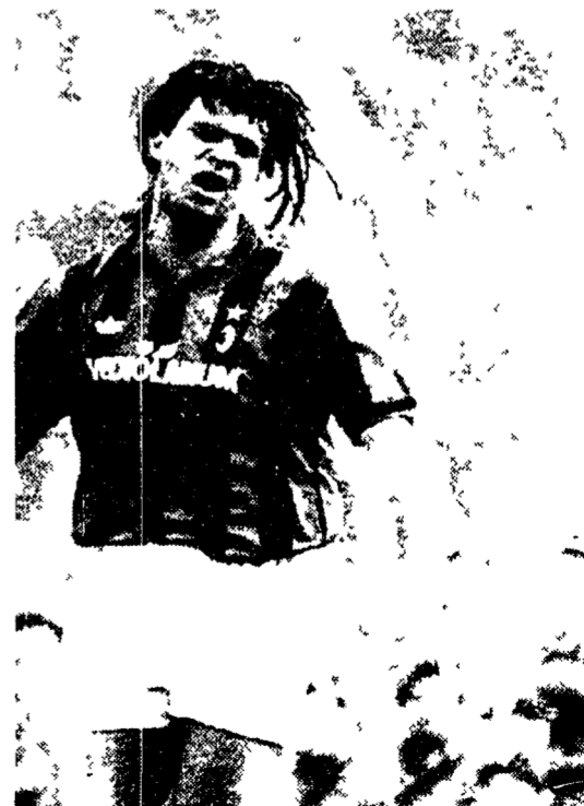
Ruud Gullit, il calciatore olandese con radici nel Suriname