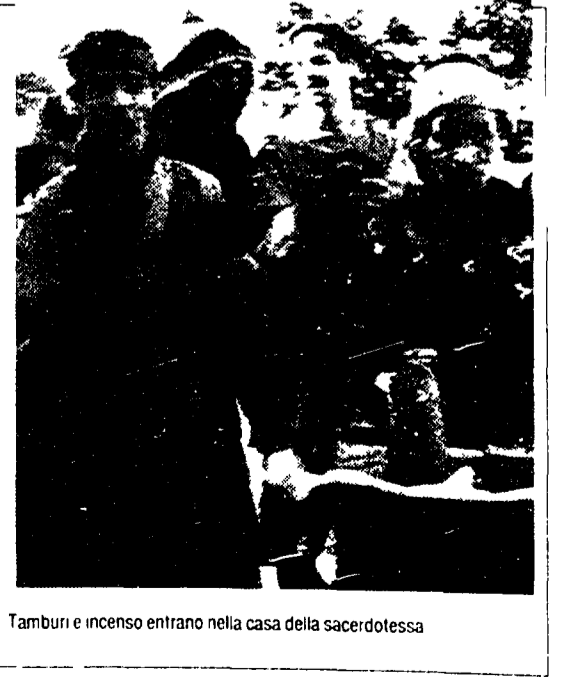
Tamburi e incenso entrano nella casa della sacerdotessa

Banchi Nuovi «Palma fiorita e sole incatenato»