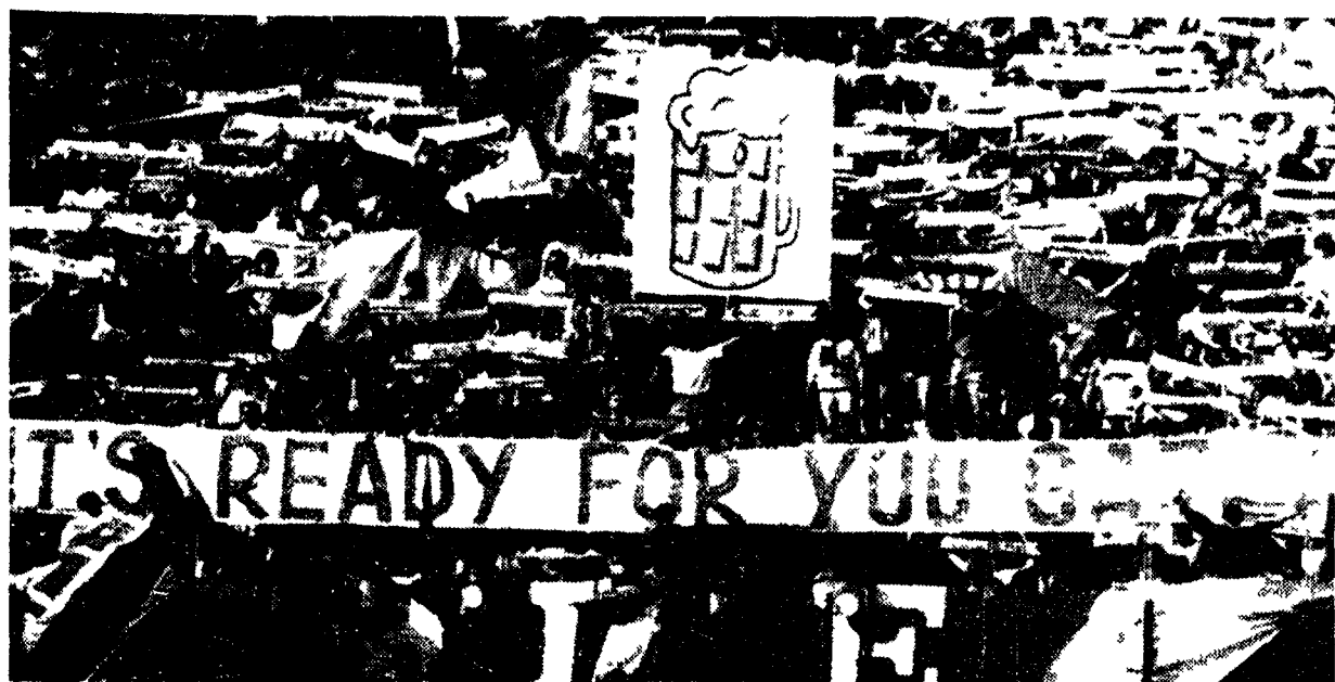
Tifosi nello stadio Olimpico sotto il bomber della Lazio Giuseppe Signori