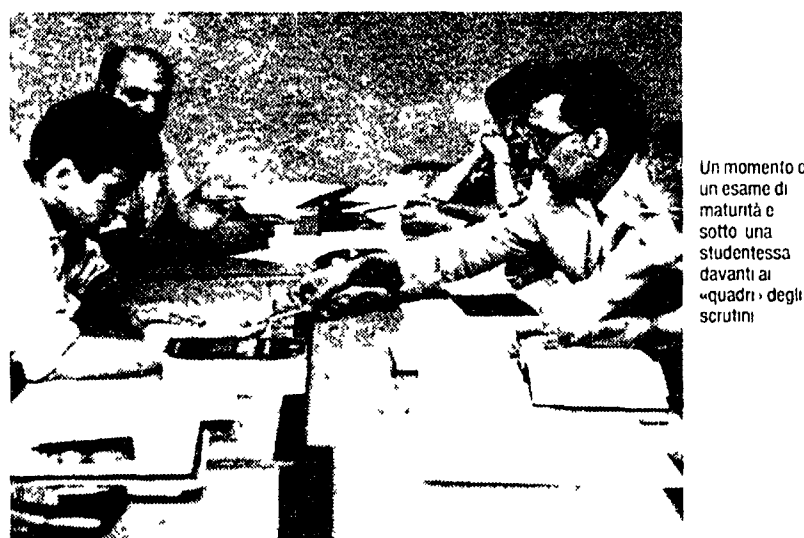
Un momento di un esame di maturità e sotto una studentessa davanti ai «quadri» degli scrutatori.

«Vero che si possa avere esami riformati già per la maturità dell'anno '93-94?»