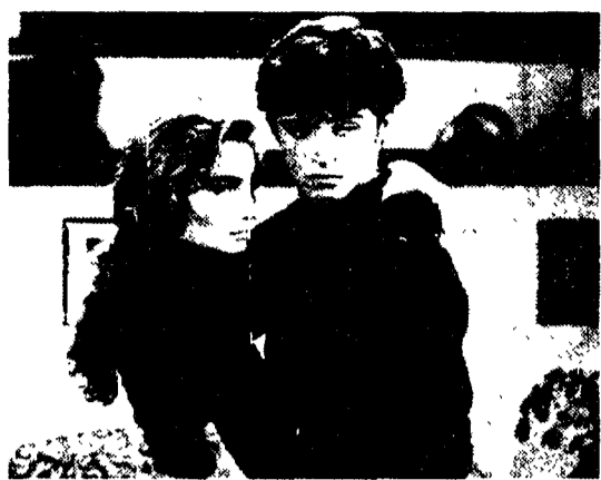
Una scena di «Il cielo non cade mai»