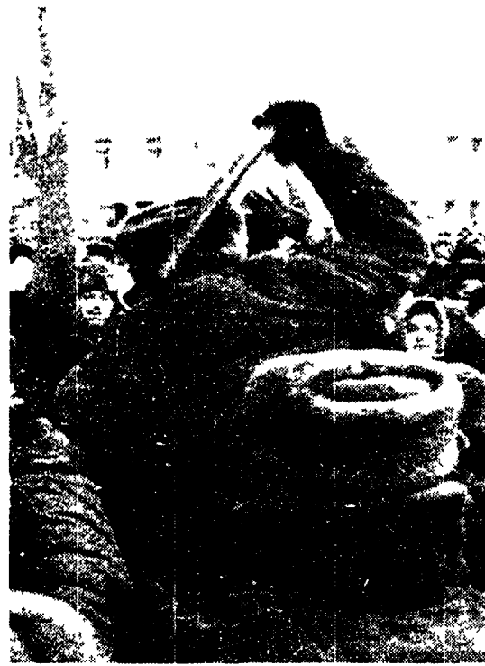
Miliziani caricano militanti neocomunisti sulla piazza Rossa a Mosca

Il metodo del tiro alla fune proseguirà anche al Congresso. Ma la cosa più probabile è che tutto si concluderà con un ordinario compromesso fra il parlamento e il presidente, sino al successivo Congresso di primavera il quale dovrà approvare la nuova costituzione.