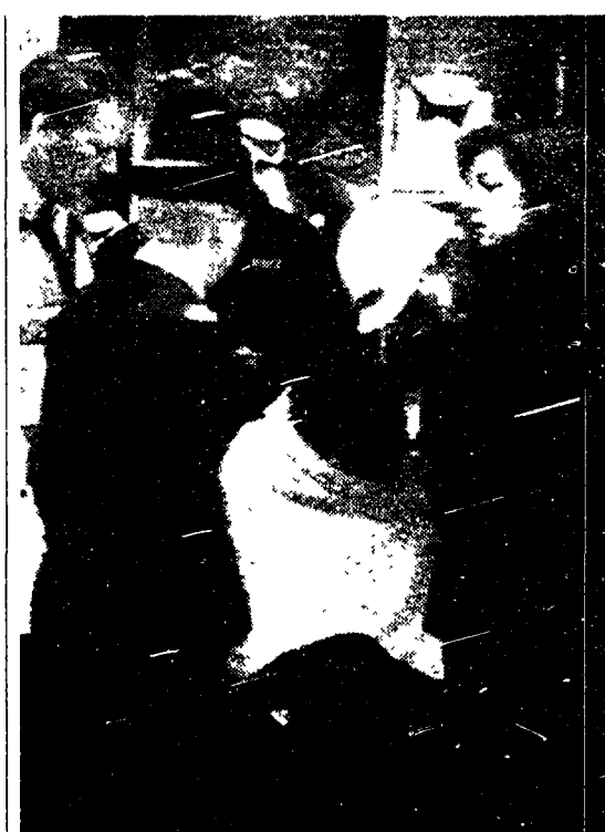
Un passante ferito dall'esplosione di Manchester soccorso dalla polizia

Le conseguenze avrebbero quindi potuto essere molto più pesanti. Anche di recente le azioni dell'Ira in punti nevralgici delle città inglesi hanno provocato morti e feriti gravi.