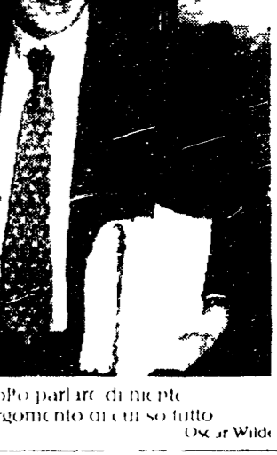
Amo molto parlare di me. E' l'unico argomento di cui so tutto. Oscar Wilde

coltura. Non si incontrano facilmente nella vita personale che parlino in questo modo. Almeno a me non ce ne sono mai.