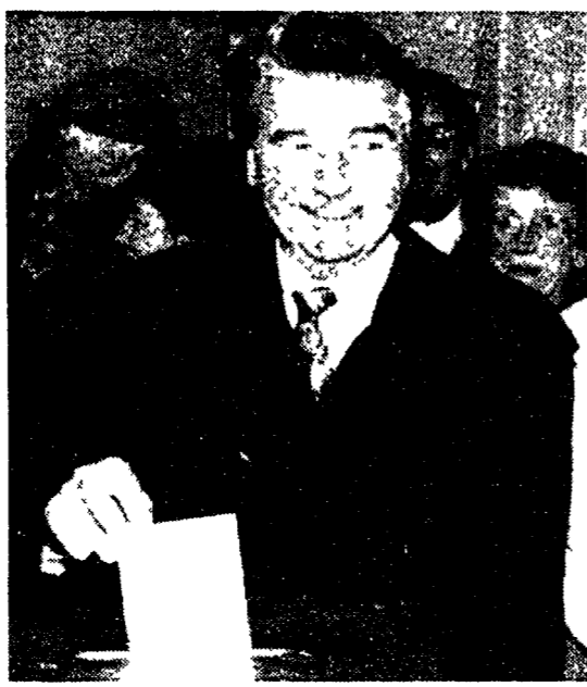
Il presidente svizzero Rene Felber

La Svizzera, novella Danimarca, ha bocciato l'ingresso nello Spazio economico europeo. Il 50,3% della popolazione ma ben 18 cantoni su 26, si sono dichiarati contrari a far parte dell'anticamera economica dell'Europa unita.