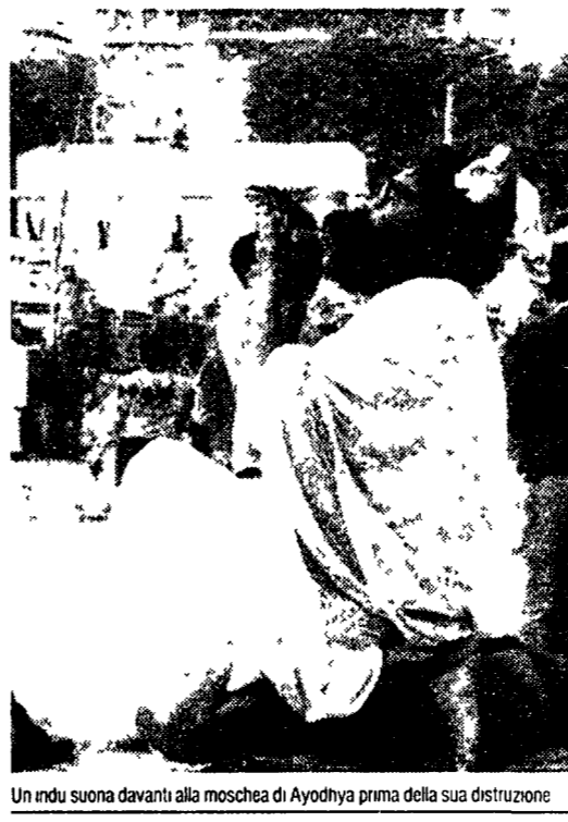
Un indu suona davanti alla moschea di Ayodhya prima della sua distruzione

che il partito nazionalista si è affermato come la seconda forza politica del paese dopo il Congresso e ha conquistato il controllo di quattro dei 25 Stati indiani.