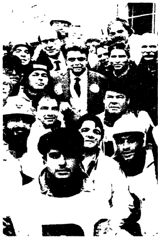
Occhetto al fianco dei minatori del Sulcis

Impegni sul litorale romano per Achille Occhetto il segretario del Pds è intervenuto ieri a Fiumicino per sostenere la lista «Alleanza di progresso» e subito dopo si è incontrato a Palidoro con la delegazione dei minatori del Sulcis che sbarcata a Civitavecchia dalla Sardegna, sta marciando su Roma. A Fiumicino Occhetto ha attaccato «la vecchia Dc e il vecchio Pci», la Rete di Orlando e la lega di Bossi. A Palidoro ha incontrato i minatori, che oggi saranno a San Pietro dal Papa e li ha incoraggiati a lottare. «Siamo al vostro fianco».