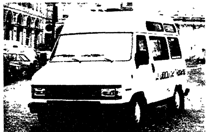
Uno dei due Ducato Elettra in movimento nel centro storico torinese. Il servizio gratuito viene effettuato dalle ore 9 alle 13 e dalle 15 alle 20. Dieci posti a sedere ciascuna sulle «navette» non sono previsti passaggi in piedi.

I comfort di marcia e eccellente lentezza di marcia sono stati sperimentati in un veicolo silenzioso. Ma il Comune (promotore con Fiat) non lo pubblicizza a sufficienza. Un giorno di prova è stato fatto. Il servizio si svolgeva in un parcheggio in via XX Settembre. Gli autobus erano un'autostrada. I passeggeri erano un'autostrada. I passeggeri erano un'autostrada. I passeggeri erano un'autostrada.