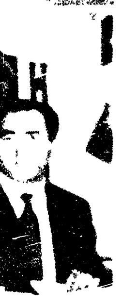
Il ministro della Giustizia...