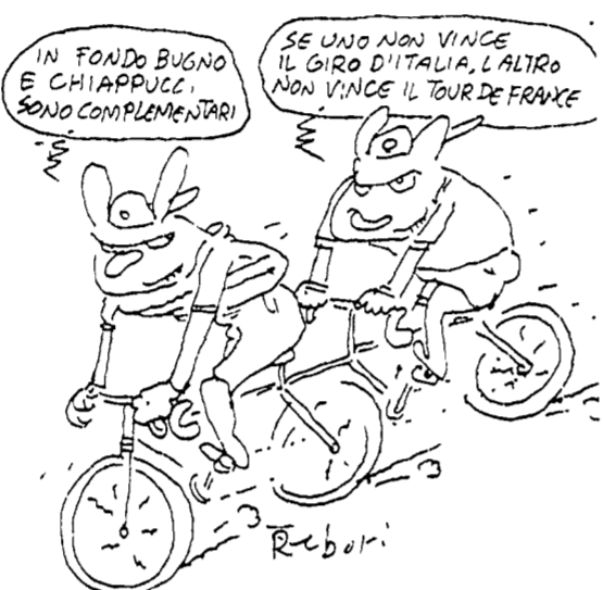
IN FONDO BUGNO E CHIAPPUCCI SONO COMPLEMENTARI. SE UNO NON VINCE IL GIRO D'ITALIA, L'ALTRO NON VINCE IL TOUR DE FRANCE.