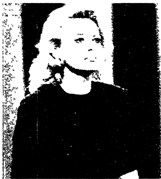
Loretta Goggi è tornata in tv con «Il Canzoniere delle feste»