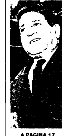
A PAGINA 17