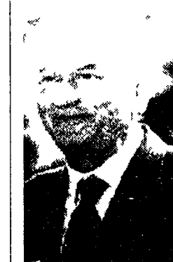
R. ARMENI A PAGINA 15