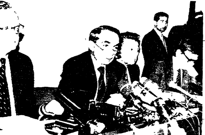
Alla fine resta il quadripartito La spunta Amato, Craxi bocciato

Mille chili di tritolo sull'autostrada che da Palermo va a Punta Raisi. Per il giudice Falcone, simbolo della lotta alla mafia... sciolto il nodo Quirinale