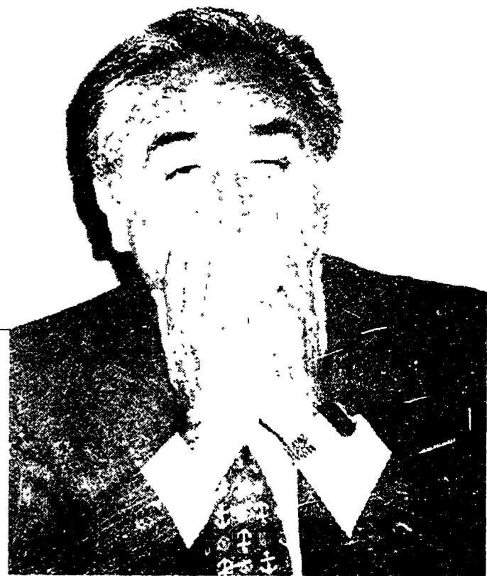
L'Esternatore se ne va L'annuncio? In diretta tv

Inverno '43, gli alpini sono sul fronte russo. Se ne riparla perché lo storico Andreucci annuncia d'aver trovato negli archivi di Mosca, un'inedita lettera di Togliatti... «Stampa» scopre che è una «bufala»