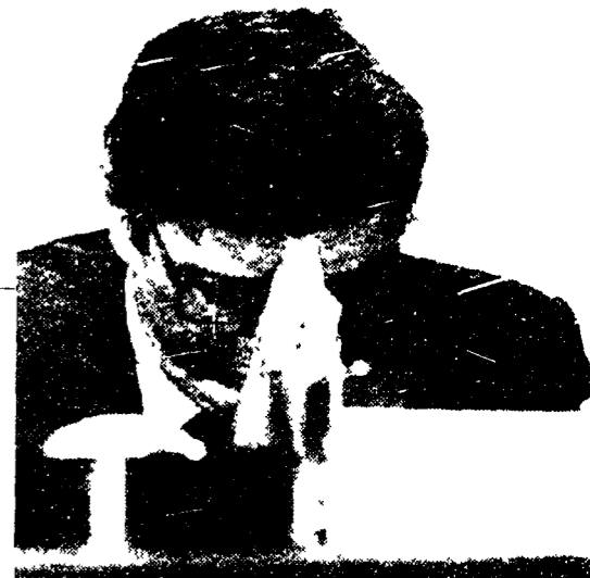
Un mese e Scotti lascia il governo pensando alla segreteria dc

Senza amici al Quirinale, Craxi deve rinunciare a Palazzo Chigi. Riesce però a piazzare Amato. Per un po' si parla di nuove alleanze... rinnovamento» si risolve con la nomina di Ronchey