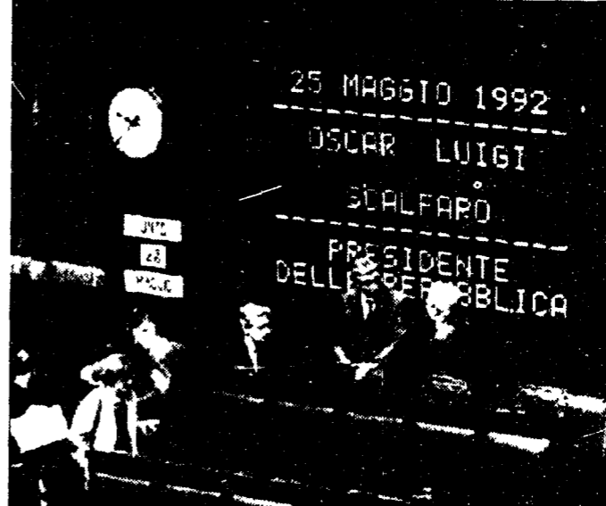
L'Italia piange Falcone Sciolto il nodo Quirinale

Mille chili di tritolo sull'autostrada che da Palermo va a Punta Raisi. Per il giudice Falcone, simbolo della lotta alla mafia... sciolto il nodo Quirinale