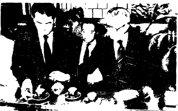
La grande paura impone la svolta a piazza del Gesù

Dopo il 5 aprile Forlani si dice disposto a lasciare la segreteria dc. Cominciò il lungo tira e molla. Fino al voto di Manovra. Finalmente, ad ottobre, la Dc elegge Martinazzoli. Vaole rimandare la Dc. Ma l'indignazione dei membri del Parlamento non gli riesce