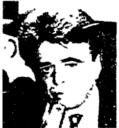
Occhetto: «In Parlamento la proposta di Martinazzoli»