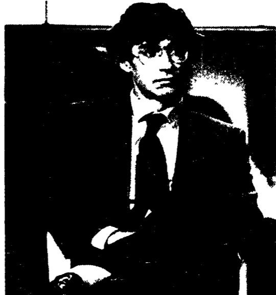
Il leader della Lega Umberto Bossi