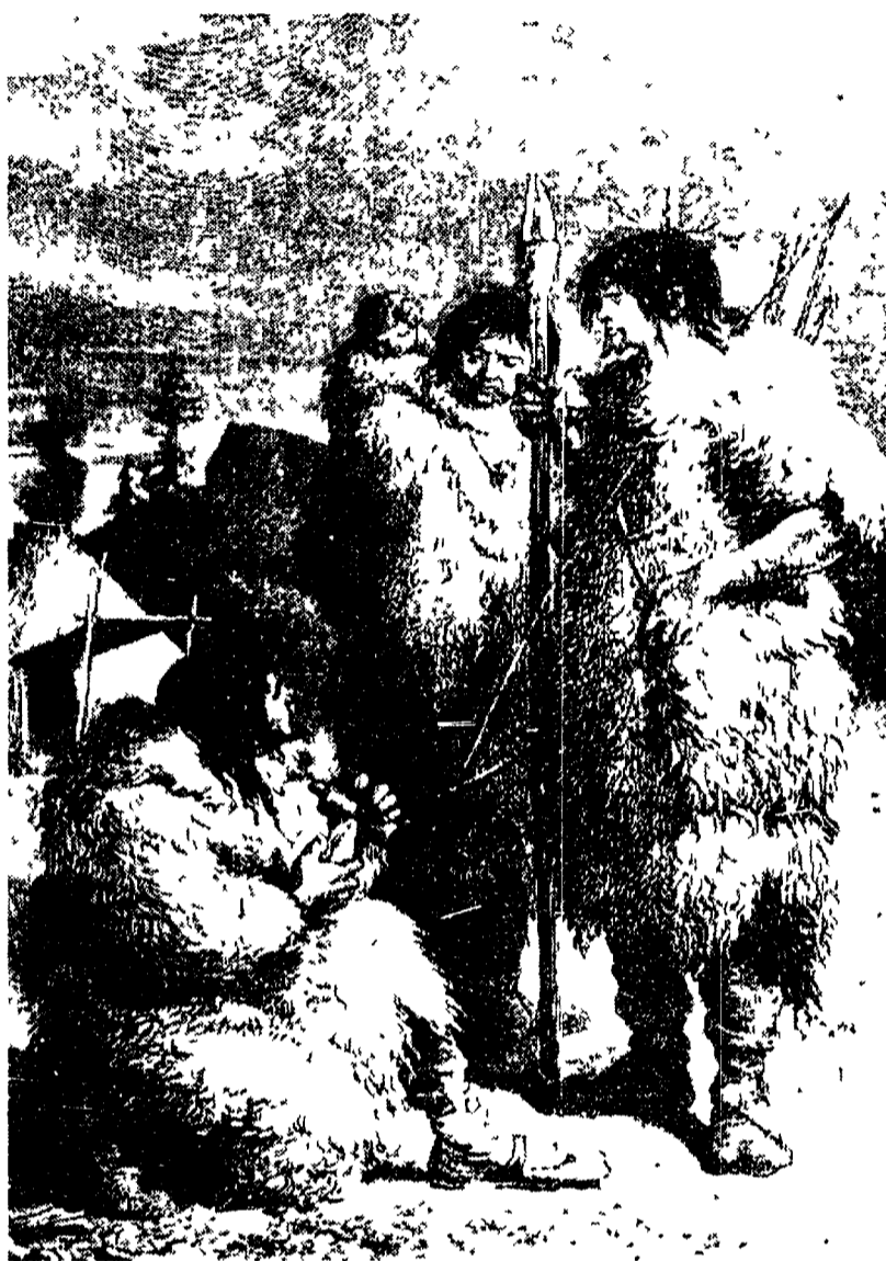
Uomini della preistoria